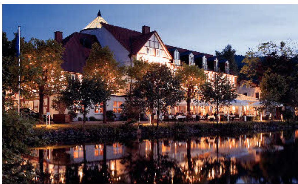
Das Landhaus „Zu den Rothen Forellen“ – eine ideale Basis für Entdeckungstouren.