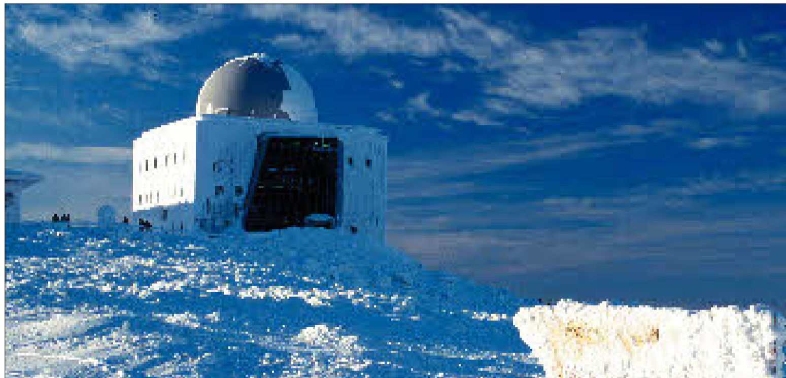
Auf dem Brocken (1141 m) liegt seit einem Monat Schnee – ein Ausflug mit der Dampfbahn gehört zu den Highlights jeder Harz-Visite.