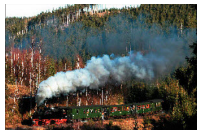
Die Brockenbahn bietet eine urgemütliche Zockelei in die Höhe.

Infos: ○ www.quedlinburg.de ○ www.wernigerode.de ○ Landhaus „Zu den Rothen Forellen“, www.rotheforelle.de ; ○ Harzer Schmalspurbahnen, Wernigerode, www.hsb-wr.de