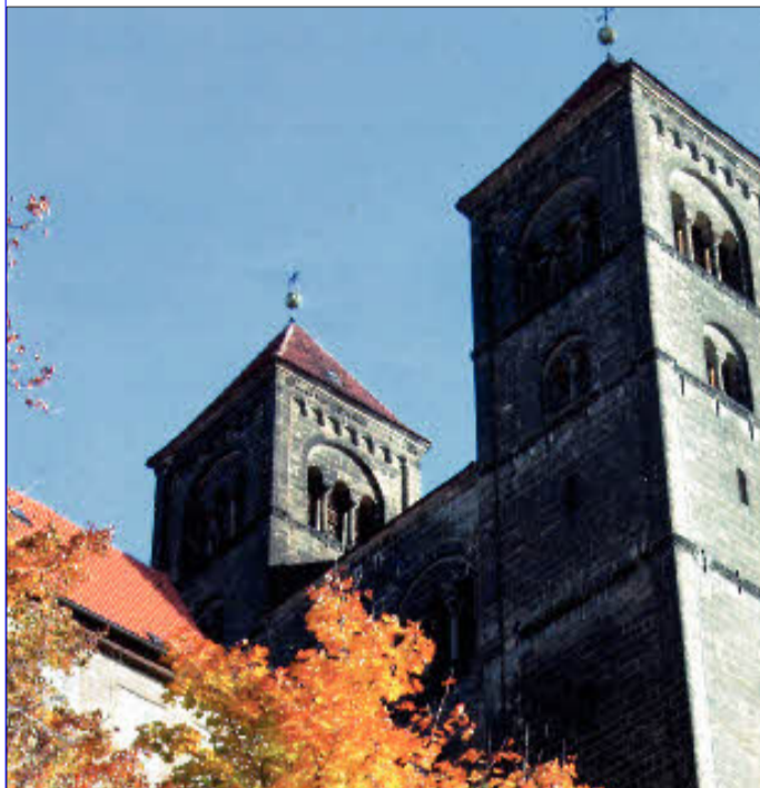
Unesco Welterbe: Quedlinburg mit der imposanten Stiftskirche.