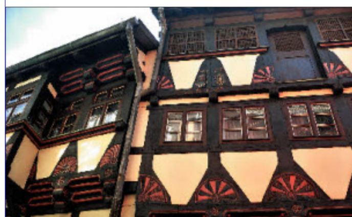
Für Fachwerkfreunde ist die Gegend geradezu ein Mekka.