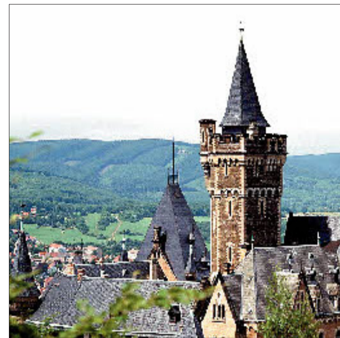
Zeit für Romantik und einen Museumsrundgang: das Fürstenschloss zu Wernigerode